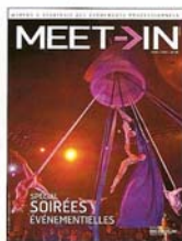
En couverture : Milla, une ouverture au cœur des éléments par la troupe Les Farfadés.